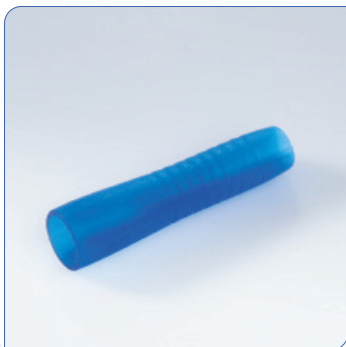
• Blue Grip®

Curan hydrophile Katheter haben eine wasserbindende Oberfläche, frei von dem aggressiven Weichmacher DEHP und einzeln steril verpackt. Sowohl der Männer- als auch der Frauenkatheter haben glatt polierte Augen, welche das Risiko einer Verletzung beim Einführen drastisch reduzieren und Irritationen vermeiden helfen. Gleichzeitig unser einzigartiger Blue Grip®, ein geniales Zubehör für das hygienische Einführen des Katheters, ohne ihn berühren zu müssen. Das erleichtert das Katheterisieren, ist hygienischer und senkt deutlich das Risiko von Infektionen.