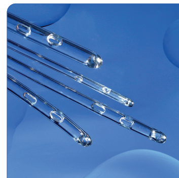
• Glatte polierte Augen

Fragen stellen, zuhören, nachdenken und handeln - darum geht es bei Curan. Wir entwickeln und produzieren äußerst zuverlässige und innovative Produkte, die gemäß der Bedürfnisse der Endanwender und Fachleute hergestellt werden. Wir streben danach, die Lebensqualität von Menschen zu verbessern, die an Inkontinenz leiden, indem wir hochwertige Produkte entwickeln, produzieren und vertreiben, die unseren Endanwendern eine angenehme, hygienische, schmerzfreie und problemlose Lösung für intermittierende Katheterisierung bieten.