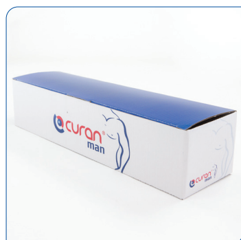
• 30er Packung