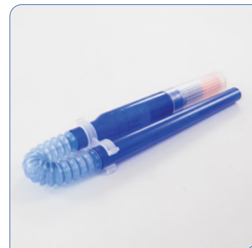
• Kompaktes Design