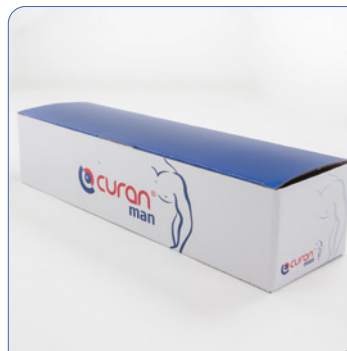
• 30er Packung